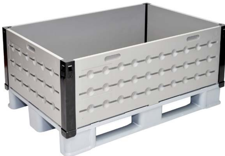
Un duo parfait: euroframe 1200 x 800 mm sur une UPAL-U.